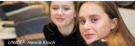
UNICEF/ Henrik Kloch